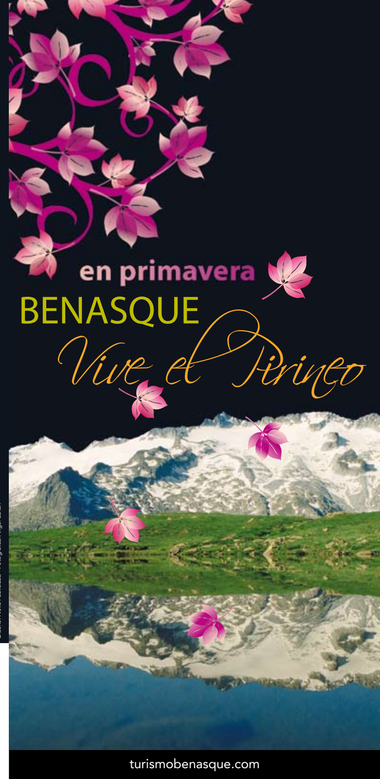
Diseño: Nova Publicidad